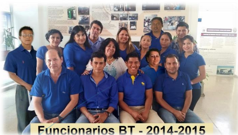
Funcionarios BT - 2014-2015