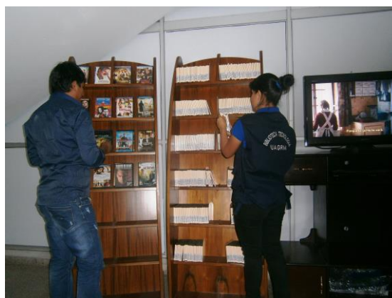
Habilitación de espacio y equipamiento de la Sección biblioteca virtual