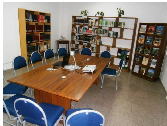
Sala de investigación Planta Baja