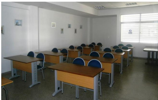
Sala de estudios 1-2-v 3 Planta Alta