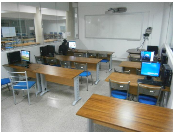
Equipamiento de una sala de la Sección biblioteca virtual